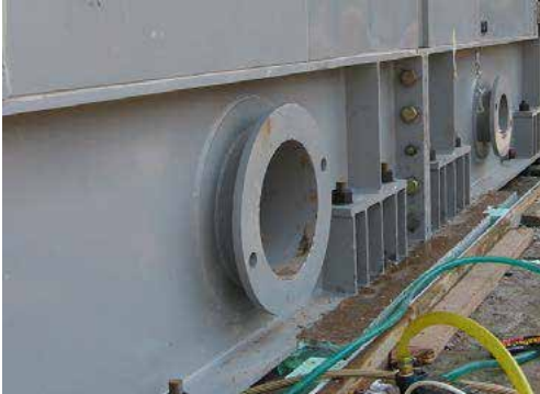
Şekil 1. Grout dökümünden önce türbin temelinin ankraj deliklerinde suya doyurma ve fazla suyu tahliye etme işlemleri

Beton yüzeyde donmuş kısımlar, kürtleme amaçlı kullanılan membranlar, su yalıtımı uygulamaları, yağ lekeleri, kaymak tabakası ve toz iyice temizlenmelidir. Beton yüzeyler pürüzlendirilerek hazırlanmalı ve eğer su sızıntısı varsa tahliye edilmeli veya uygun bir şekilde tıkanmalıdır. Grout dökümünden 24 saat önce döküm yapılacak alan suya doyurulmalıdır. Yüzeyler nemli olmalı fakat yüzeyde fazladan serbest su kalmamalıdır. Özellikle civata deliklerine dikkat edilmeli ve bu deliklerin su içermediğine emin olunmalıdır. Gerektiğinde deliklere ve boşluklara basınçlı hava uygulayınız. Taban plakaları, civatalar, vb. yağ, gres ve boya gibi maddelerden arındırılmalı ve temiz olmalıdır. Ekipman yerleştirilmeli ve konumu ayarlanmalıdır. Ayar takozları (şimler) grout priz aldıktan sonra çıkartılacak ise, groutun yapışmaması için hafifçe yağlanmalıdır.