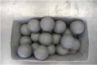
Şekil 2. Darbe için kullanılan çelik toplar