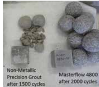
Şekil 3. 1500 ve 2000 çevrim sonrasında grout numuneleri.